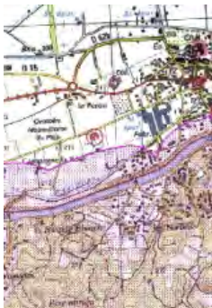
Carte délimitant les espaces soumis à la réglementation du débroussaillage, éditée par la Préfecture

L'identification des administrés concernés s'effectue à partir de :