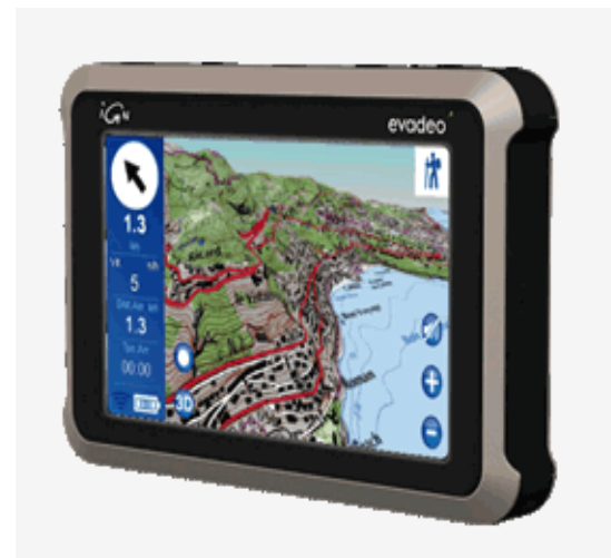
A la journée de Sisteron : présentation et utilisation du GPS Evadéo X60 qui inclus les cartes IGN ainsi que les principaux outils de cartographie

Intervenant : Bernard PETIT Technicien spécialisé en cartographie forestière