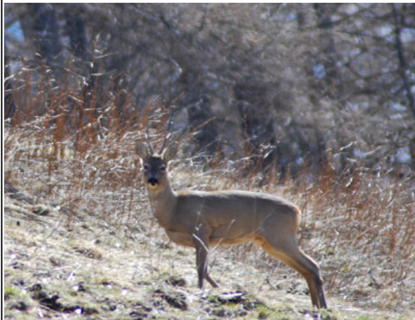
Avril 2008, Ceillac 05