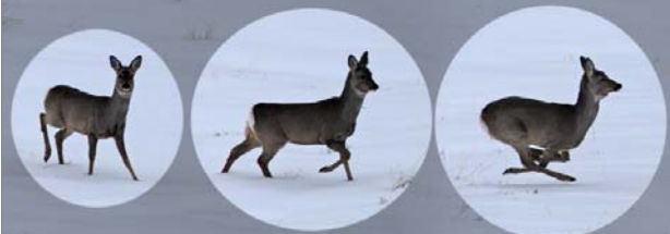
Avril 2008, Ceillac 05