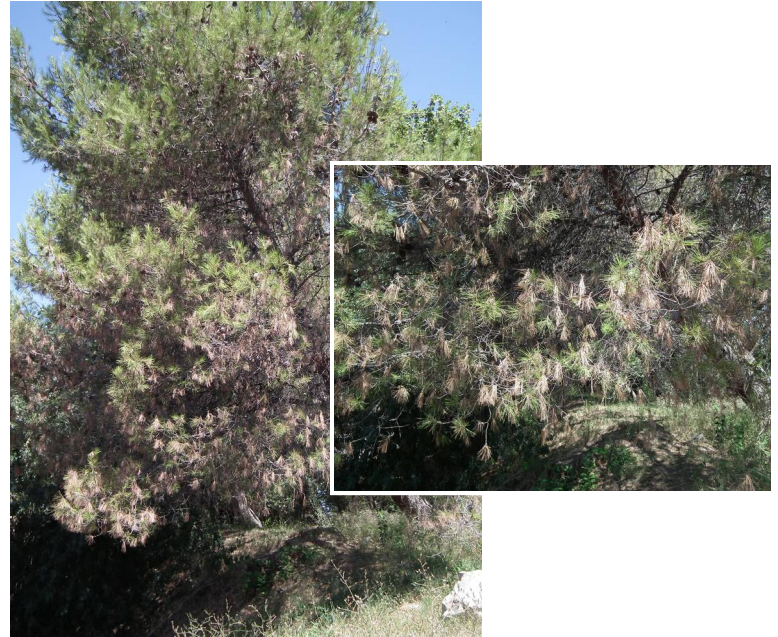
Photos n°1 et n° 2 : pin d'Alep atteint par la maladie chancreuse

Les dégâts sont dus à Crumenulopsis sororia , agent de la maladie chancreuse du pin d'Alep dont le développement a été favorisé par la forte pluviométrie de l'automne 2014.