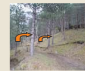
Élaguer les arbres

En aucun cas « débroussailler » ne signifie « couper tous les arbres »