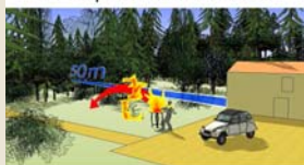
pour protéger la forêt (risque induit)