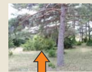
Éliminer les broussailles

Éliminer les rémanents = réduire l'intensité de l'incendie