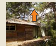
Séparer les arbres