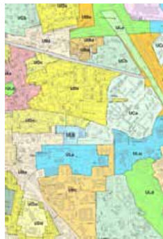
Document d'urbanisme de la commune : POS ou PLU