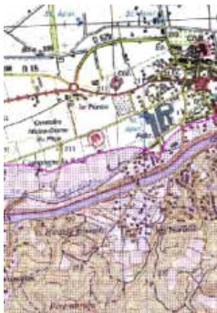
Carte délimitant les espaces soumis à la réglementation du débroussaillage, éditée par la Préfecture

L'identification des administrés concernés s'effectue à partir de :