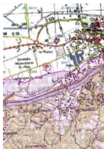
De la carte délimitant les espaces soumis à la réglementation du débroussaillage, éditée par la préfecture

L'identification des administrés concernés s'effectue donc à partir :