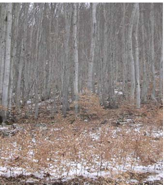
Apparition de semis dans une trouée.