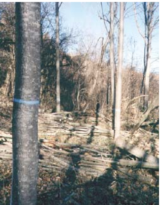
Type H5 - A terme, les éclaircies permettent d'envisager la récolte de bois d'œuvre.