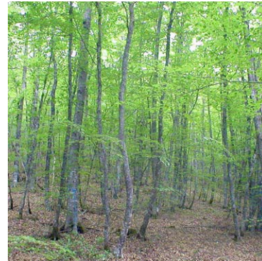
Type H2 - Le nombre de tiges d'avenir est suffisant pour envisager une éclaircie à leur profit.