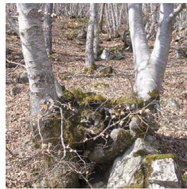
Type H2 - Ce taillis présente un mauvais ensouchement (souches hautes et déformées). Sa capacité à rejeter de souche est incertaine.