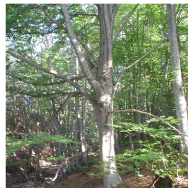
Type H2 - La présence de semenciers permet d'envisager une régénération naturelle par coupes progressives.