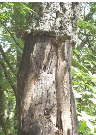
Conséquence d'une mauvaise levée : la récolte du liège doit être réalisée dans de bonnes conditions si l'on ne veut pas affecter l'état sanitaire des peuplements.