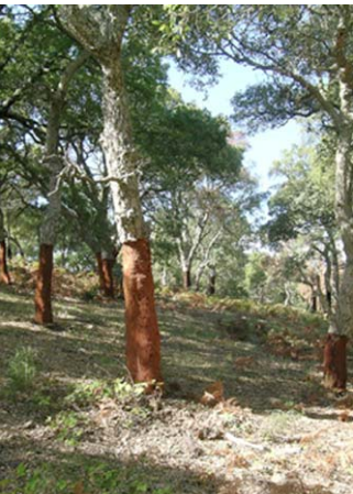
Type L3 - Travaux de rénovation.