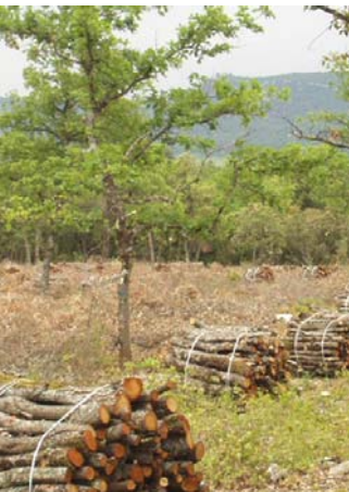
Type C3 - Les coupes de rajeunissement (gestion en taillis) procurent des revenus intéressants (bois de chauffage).