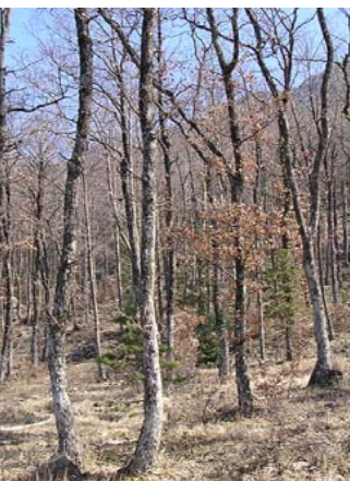
Type C4 - Sur très bonne station les éclaircies conduisent à une individualisation des brins (futaie sur souche).